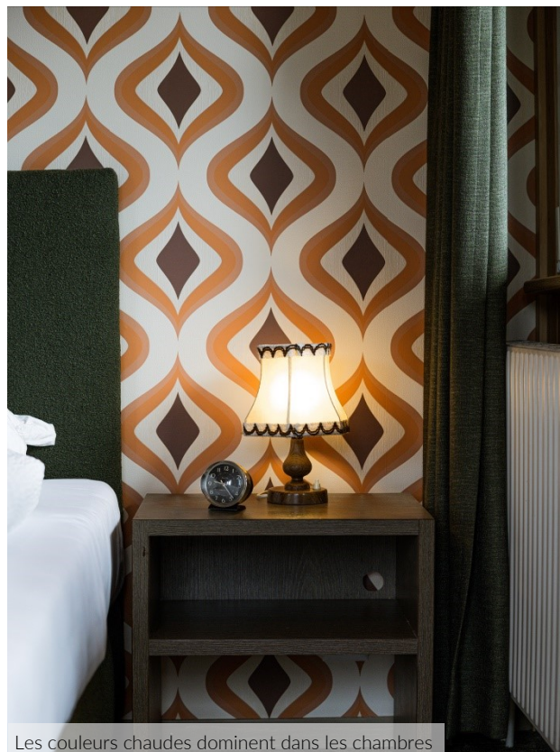
Les couleurs chaudes dominent dans les chambres