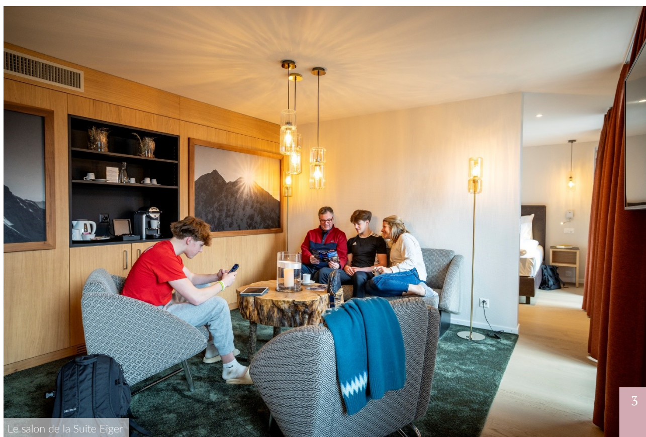
Le salon de la Suite Eiger