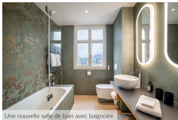
Une nouvelle salle de bain avec baignoire

Nous sommes particulièrement fiers de la rénovation intégrale de la Suite Eiger, chambre 422. Avec ses 65 m 2 , elle offre aux hôtes une nouvelle sensation d'espace dans une atmosphère élégante et lumineuse grâce à des matériaux naturels. La chambre a été équipée d'une cabine à infrarouges privée pour