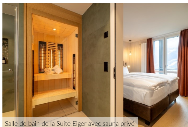
Salle de bain de la Suite Eiger avec sauna privé