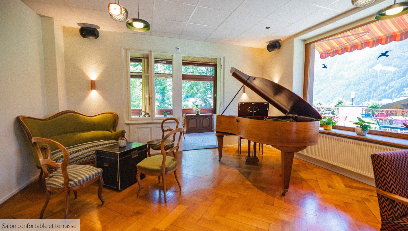
Salon confortable et terrasse