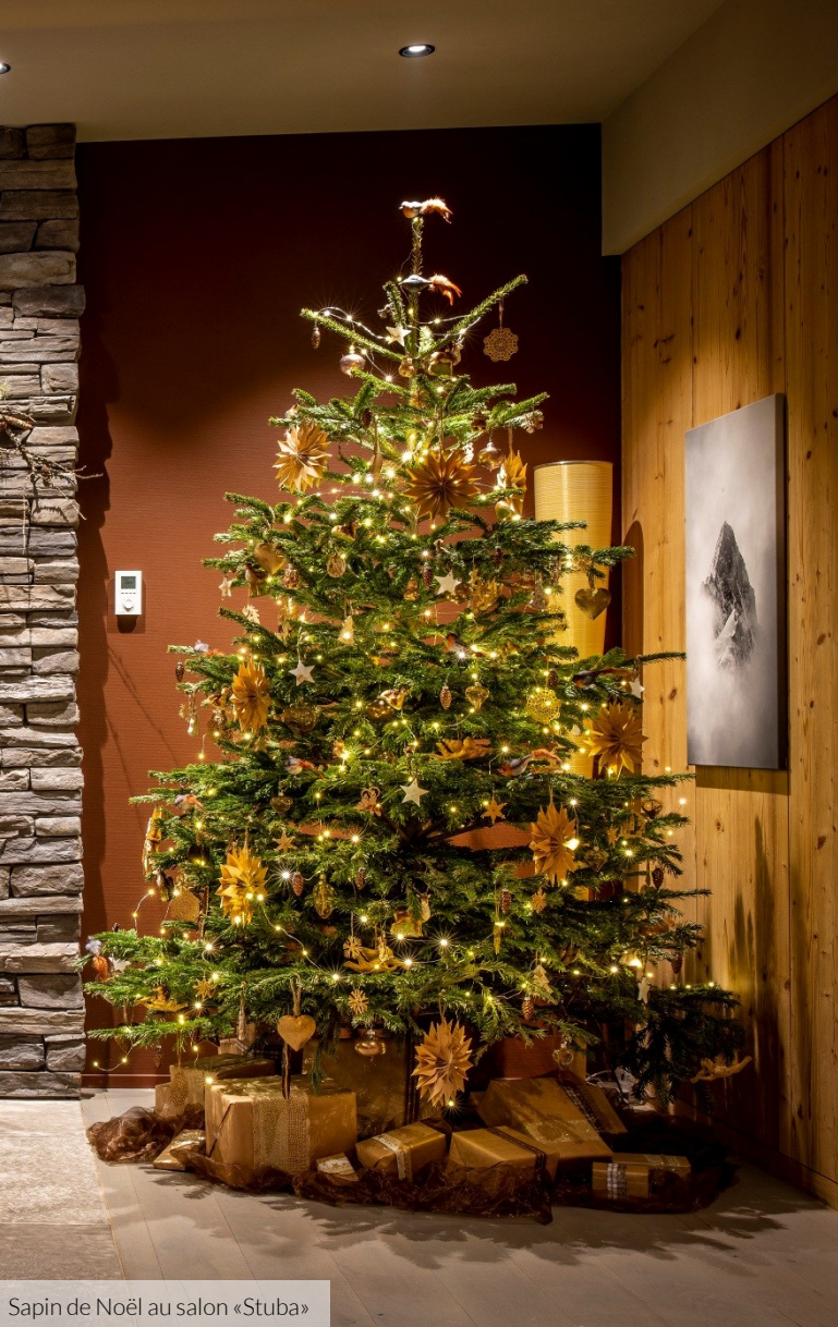
Sapin de Noël au salon «Stuba»