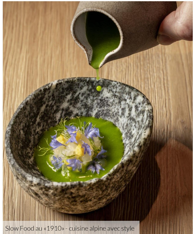
Slow Food au «1910» - cuisine alpine avec style

L'équité est indissociable de l'écogastronomie. Elle s'exprime pleinement quand on connaît les personnes qui se cachent derrière les produits. Nous travaillons avec des producteurs de notre région dont nous connaissons et apprécions le travail. Les légumes proviennent de BioRiem à Kirchdorf, les fromages et les produits laitiers nous sont fournis par Eigermilch à Grindelwald. Le poisson provient d'élevages durables. Les champignons et les baies, nous les cueillons nous-mêmes à Grindelwald. Le gibier mis à la carte à l'automne provient de chasseurs de l'Oberland bernois. Pour nous, la transparence sur les origines n'est pas